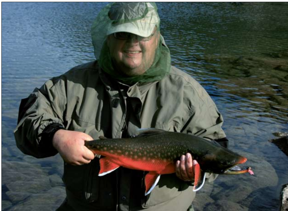
Forfatteren med en de flotte farvede fisk.

De fleste af os skal grave dybt i økonomien for at få råd til en sådan tur. Transporten er dyr – både til og i Grønland og opholdet i ødemarken, hvor man skal have alt med og alt med tilbage, gør også turen dyrere. Jeg stille gerne op med information i det omfang, jeg kan – min email er jbs@fiskpaaflye.dk .