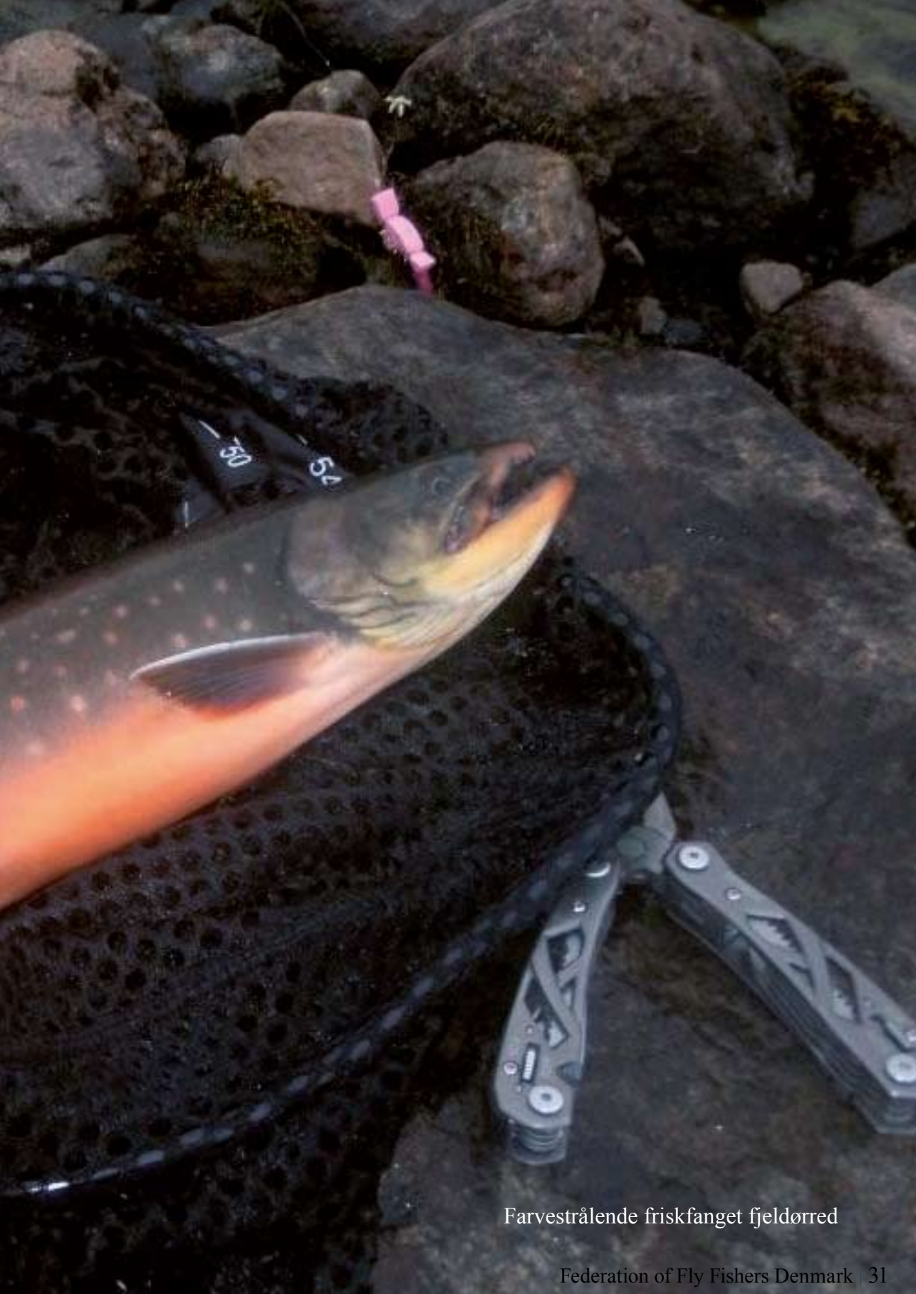
Farvestrålende friskfanget fjeldørred